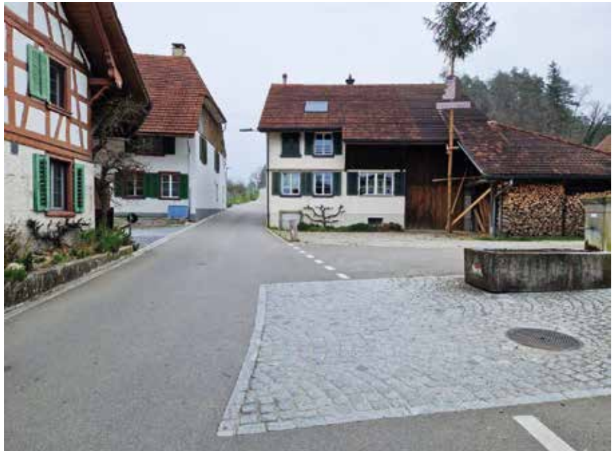
Engstelle auf der Geigenhofstrasse in Hüttlingen: Hier gilt Tempo 30.

Wir haben Klagen wegen des Verkehrs auf der Geigenhofstrasse und in Harenwilen erhalten. Messungen innerhalb der Tempo-30-Zone an der Geigenhofstrasse haben ergeben, dass die Geschwindigkeiten in Richtung Osten deutlich zu hoch sind. 15 Prozent der Fahrzeuge waren mit 47 km/h oder schneller unterwegs, was bei einer polizei-