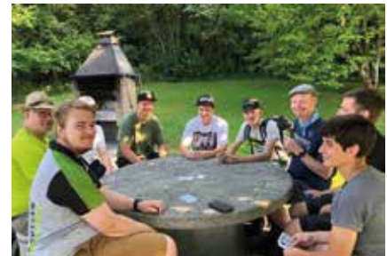
Weggis, im September 23: Auf der Jungschützenreise wird in den Pausen oft gejasst.