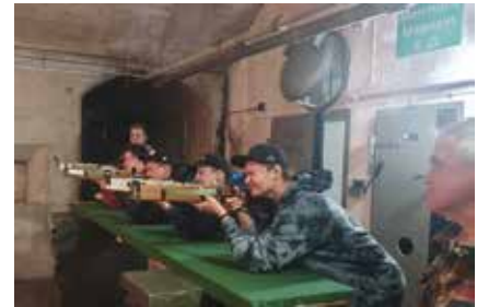
In der Festung Vitznau haben wir mit der Armbrust geschossen und in Militärbetten übernachtet.