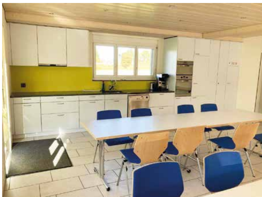
Einblick in das Bürgerlokal

Der Grillplatz des Eschikofer Bürger- und Dorfvereins